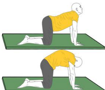
Yoga: Postura del gato y del perro