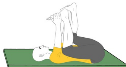
Yoga: Postura del bebe feliz