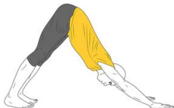
Yoga: Postura del Perro