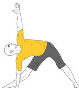
Yoga: Postura del Triangulo