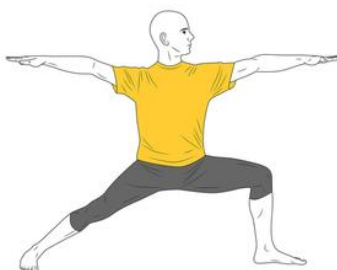
Yoga: Postura del Guerrero 2